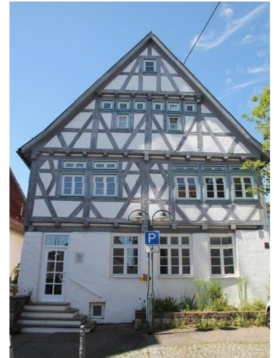
Unser neues Domizil im U14

im Auftrag des Bildungs- und Sozialwerks im LandFrauenverband Württemberg Baden e.V.